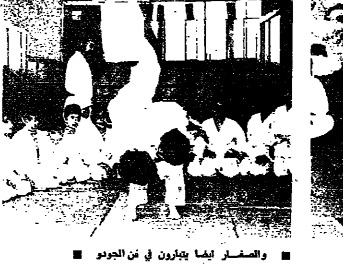
والصغار ايضا يتبارون في فن الجودو